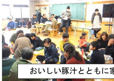
おいしい豚汁とともに家族みんなで昼食です