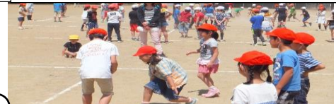
低・中・高学年に分かれて、ドッジボール大会が行われました。（体育集会）