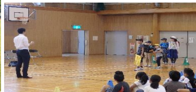
「いかのおすし」の大切さを実感し、みんな真剣に話を聞いていました。（熱中症予防）