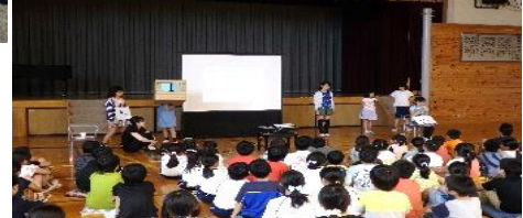
「穂坂小の児童が、健康で安全に生活できるように…」と、熱中症予防についてわかりやすく伝えてくれました。（保健委員会）