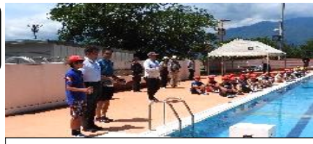
きれいなプールで安全を願いました。（プール開き）