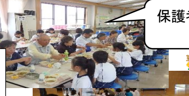
保護者や祖父母の皆様方が来てくださ