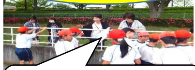
自己ベストを目指して子どもたちはがんばりました。